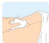
濡れティッシュなどで 拭き取ります