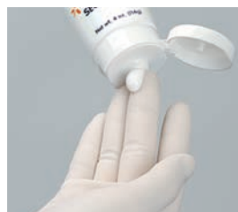
セキューラDCを適量(約1~2cm)指先に取ります。