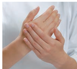
手荒れを予防ケアいただきたい医療従事者の皆さまへ。