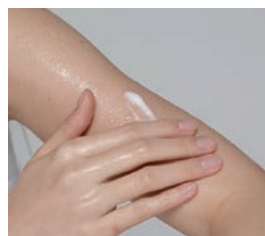
シャワー浴・入浴後の保湿スキンケアに。