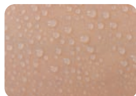
強いはっ水性で汚れを防ぎます