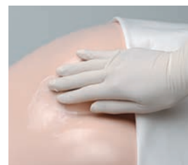
使用部位に均一に塗ってください。