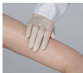
少量でもとても良く伸び腕部への保湿にお使いいただけます。