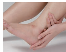
しっかりと保湿できるモイスチャークリームですので全身の保湿にお使いいただけます。