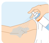
適量を吹きかけます