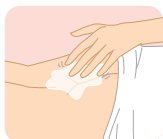
セキューラ POを塗布