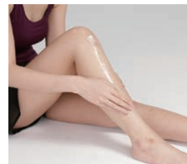
足部分・大腿部・下肢全体への保湿にお使いいただけます。