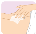
おしりまわりの保湿に