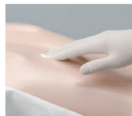
無香料・無着色・低刺激ローションタイプ保湿剤です。