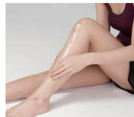
足部・下肢全体への保湿ケアにお使いいただけます。