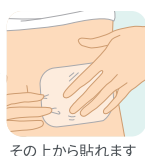
その上から貼れます